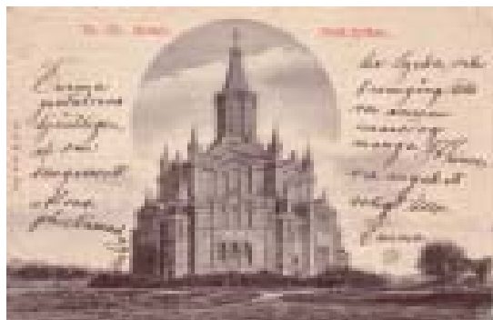
Bild 4. No. 175. Malmö. Pauli kyrkan (nummer, oskarp bildkant). Obs. det unika utseendet med bl. a. nummer och motivbenämning upptill.