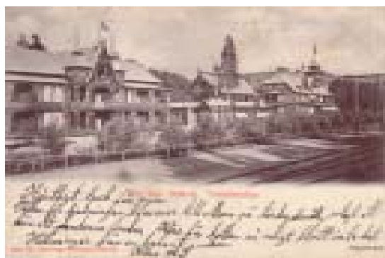
Bild 6. No 263. Rättvik. Turisthotellen Förlag Th Landberg Bokhandel, Rättvik

Vi ger här ett exempel på skillnader inom den vanligt förekommande varianten 1.7.A (se Bild 5 till höger), som vi betraktar som den ursprungliga serien för de numererade FWH-korten: