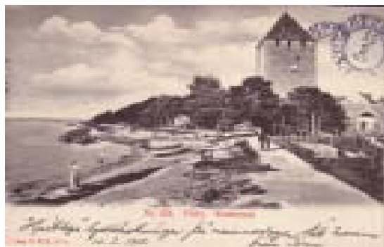
Bild 1. No. 124. Visby. Krutttornet