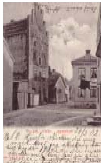
Bild 5. No 136. Visby Apoteket

Vi ger här ett exempel på skillnader inom den vanligt förekommande varianten 1.7.A (se Bild 5 till höger), som vi betraktar som den ursprungliga serien för de numererade FWH-korten: