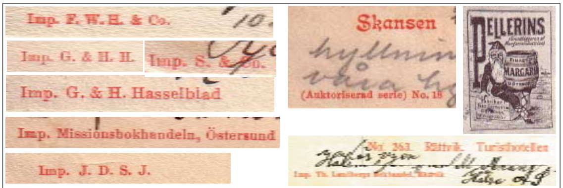
Bild 2. Kollage över förlagsbeteckningar